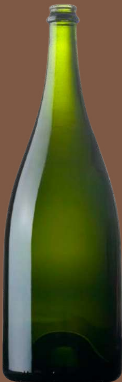
BOUT / PAL : 500