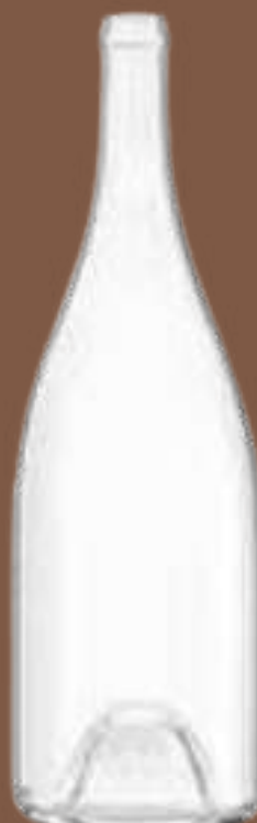
BOUT / PAL : 430