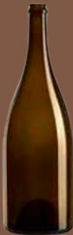
BOUT / PAL : 200